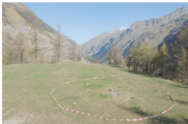
Repérage sur le lieu pour l'installation de l'œuvre, été 2011